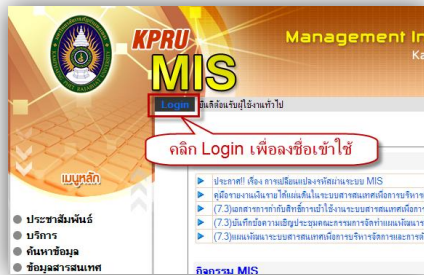
ภาพที่ 1 ปุ่มลงชื่อเข้าระบบ

1.2) คลิก “Login” เพื่อลงชื่อเข้าใช้งานระบบ (ภาพที่ 1) หลังจากนั้นลงชื่อเข้าสู่ระบบ (ภาพที่ 2) โดยเลือกประเภทรหัสผู้ใช้งานเป็น MIS Account สามารถสอบถามรหัสผู้ใช้งานและรหัสผ่านได้จากงานกรเจ้าหน้าที่ (1102,1105) และงานพัฒนาสารสนเทศอิเล็กทรอนิกส์ (1563)